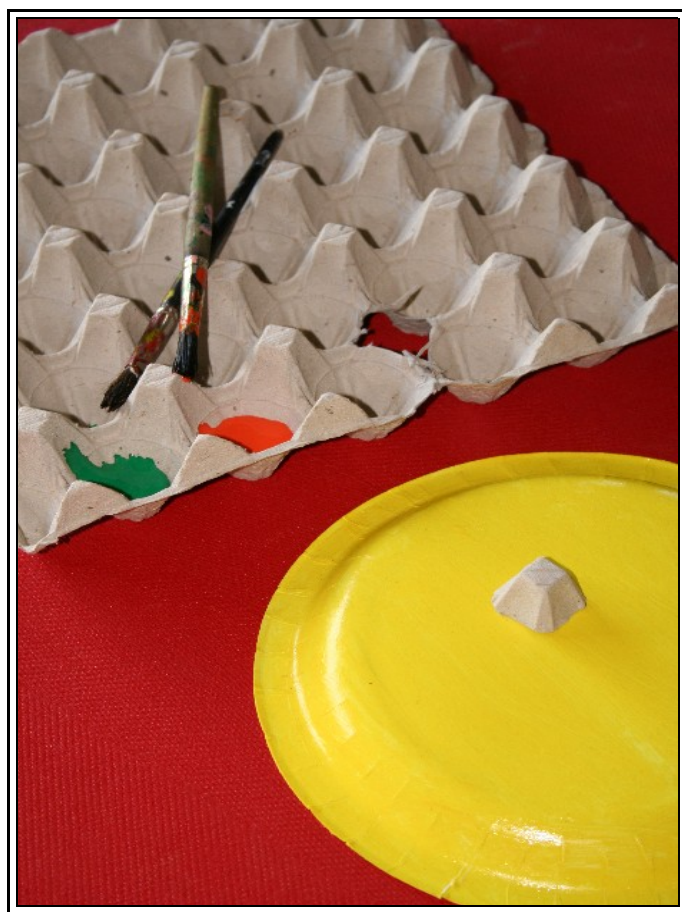
Venstre: Tomme æggebakker kan bruges til meget. Agnes bruger dem blandt andet til palet og til næser på nogle figurer.